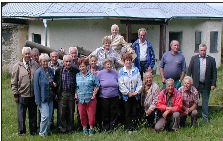
- Oslavy SNP si pripomenuli zástupcovia dobrovoľných organizácií pôsobiacich v Stráňavách a politických strán položením kytíc pri pamätníku na Javorine. Po tomto akte si účastníci stretnutia zaspomínali na minulosť a prežitú udalosť. Spoločná fotografia účastníkov stretnutia.