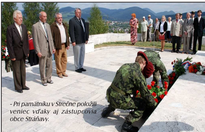
- Pri pamätníku v Strečne položili veniec vďaky aj zástupcovia obce Stráňavy.

Mnohí, tu zahynuli. Tých sedem dní, počas ktorých dokázali uchrániť Strečniansku úžinu, ukázalo svetu zmýšľanie Slovákov na fašizmus. Pán Camberle vo svojom príhovore vymenoval všetkých Francúzov, ktorí tu zahynuli a sú pochovaní na vrchu Zvonica.